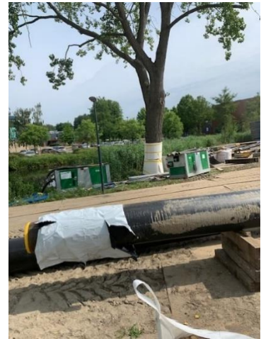
Aanleg warmtenet Groenoord

In Groenoord is in de periode 2022-2023 een warmtenet aangelegd. 16 Mooie en grote kapvergunning- en 13 meldings-plichtige bomen dreigden volgens de tekentafel-plannen gekapt te worden, de vervangende bomen leken niet het kroonvolume te krijgen van deze bedreigde bomen. Tevens bleek uit het onderzoek van de Bomenwacht (onderzoek in opdracht van de gemeente) dat voor rond de 170 bomen in het plangebied ernstige projectinvloed te verwachten was. Dit werd tijdens diverse schouwrondes ter plekke door de Bomenridders eveneens geconstateerd, op het werk kwamen we vaak bomen tegen met kaal liggende wortels en bomen waarvan de wortels door opslag van bouwmaterialen en gereedschap onder de boomkronen ernstig belast werden. De gemeente wilde in eerste instantie niet in overleg over de door ons gedane constatering.