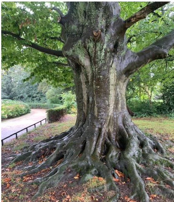
De 'Trouwboom' in het Julianapark heeft zwam, wat moet er gebeuren om de boom te behouden?

Regelmatig worden de Bomenridders door stadsgenoten benaderd met vragen en opmerkingen over mogelijk zieke bomen in de eigen tuin of in de openbare ruimte, zijn vragen gesteld over door de gemeente aangekondigde kapinitiatieven of verstrekte kapvergunningen, over door bewoners geconstateerde werkwijzen van aannemers die gevolgen kunnen hebben voor de nabijheid groeiende bomen en/of plantsoenen, etc. Kortom, de Bomenridders zijn een vraagbaak voor stadsgenoten die ons goed weten te vinden.