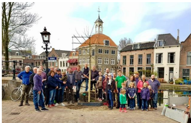
Bomenridders Schiedam bij het planten van de oprichtingsboom

In 2018 zijn de Bomenridders Schiedam opgericht als zelfstandige werkgroep van de Stichting de Bomenridders Rotterdam. In het voorjaar van 2021 is gekozen voor een zelfstandige stichting de Bomenridders Schiedam om daarmee onder eigen vlag aan fondswerving te kunnen doen, subsidies aan te vragen en de organisatie in rechte te kunnen vertegenwoordigen in bezwaar of juridische procedures.