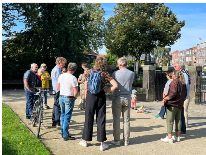
Rondleiding langs unieke bomen in Schiedam

Om stadsgenoten te informeren en te betrekken bij groene bezienswaardigheden en ontwikkelingen in Schiedam hebben we dit jaar 3 rondwandelingen door de stad uitgevoerd.