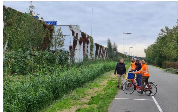
Een van de rondes bij het Trimpad

Langs de A4 iets ten noorden van de Beneluxtunnel nabij het Trimpad woekerde na de reconstructie van de locatie (o.a. nieuwe geluidsschermen) veel groen, wat een gezonde duurzame groene ontwikkeling in de weg stond. In 2022-2023 hebben de Bomenridders diverse schouwen en overleg gehad met de gemeente, projectontwikkelaar en naast liggende sportvereniging over een verbeterde herinrichting van dit gebied, mede als vervangende aanplant van de gekapte bomen op het tunneltracé. In oktober 2023 is dit afgerond en de strook door de aannemer naar tevredenheid opgeleverd.