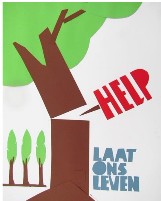
Poster door Theo Gootjes gemaakt voor de Bomenridders

Al met al een zeer tijdrovende procedure met veel overleg en administratie tot gevolg, zowel voor ambtenaren, de bezwaarschriftencommissie en de Bomenridders.